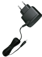
DC 12V 전원 어댑터 DC 12V POWER ADAPTER