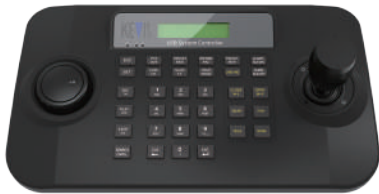
KSC-3000U 제품 본체 KSC-3000U PRODUCT

Comprised of the product body / DC 12V Power Adapter / A to B USB Cable / User Manual, the product components may change depending on the user's design needs.