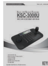
사용자 매뉴얼 USER MANUAL