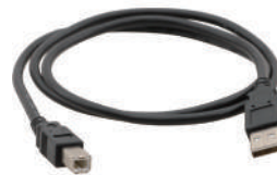
A to B USB 케이블 A to B USB CABLE